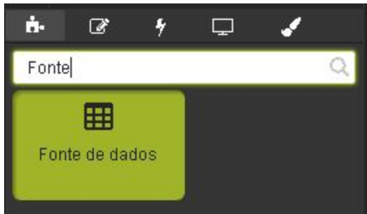
Figura 1 - Seleção do controle

Passo 1: Selecionar e adicionar o controle "Fonte de dados" na tela.