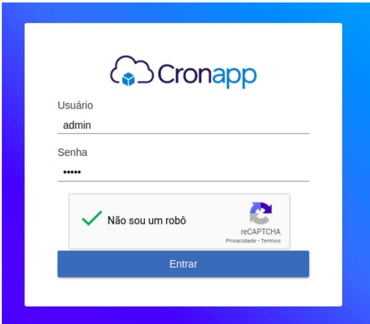
Figuras 4 - Componente de Captcha do tipo caixa de seleção em execução na tela de login